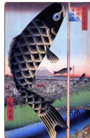
Kunstenaar Hiroshige, Ukiyo-e prent (1856-1858)