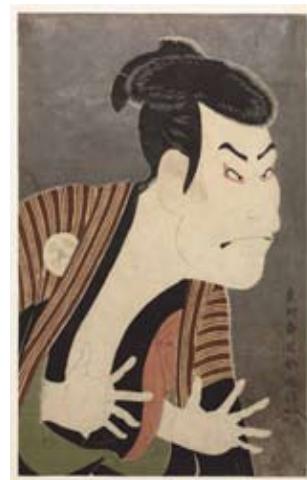
Kunstenaar Sharaku, Ukiyo-e prent (1794)