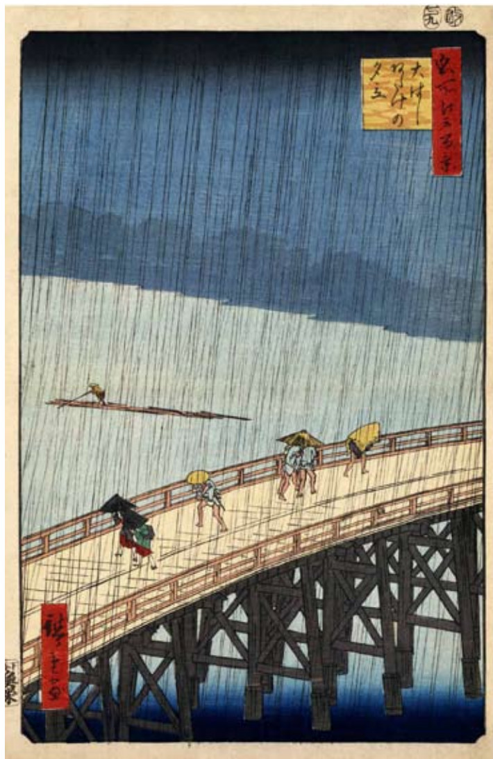
Kunstenaar Hiroshige, Ukiyo-e prent (1856-1858)

Voor mij als docent was het een moment van bewustwording hoe westers ik eigenlijk ben en denk. Ik ben gaan nadenken over mijn manier van lesgeven en de uitgangspunten vanwaar ik werk. Wat wil ik de kinderen eigenlijk meegeven met mijn lessen?