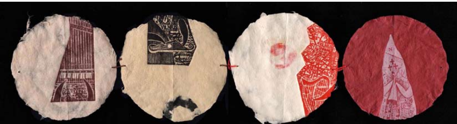
Ets op japans papier (2012)